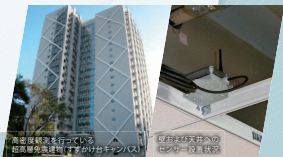
高密度観測を行っている 超層免震建物(すずかけ台キャンパス)

建物内に高密度に設置された高性能センサーによる地震・台風時における建物の安全性・継続使用性の評価および居住者への早期避難方法に関する研究プラットフォームです。建物だけでなく都市機能のレジリエンス向上への貢献を目指します。