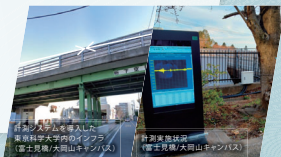
計画シミュレーションを導入した 東京科学大学内のインフラ (富士見橋/大岡山キャンパス)

スマートインフラメンテナンス教育研究フィールドは、生活や産業すべての基盤であるSustainable Social Infrastructure (SSI)を実現し、インフラのメンテナンスを確実に、都市機能やレジリエンスの確保を目指す取り組みに向けたプラットフォームです。現在、東工大学内インフラを用いた実構造物フィールドを構築中です。